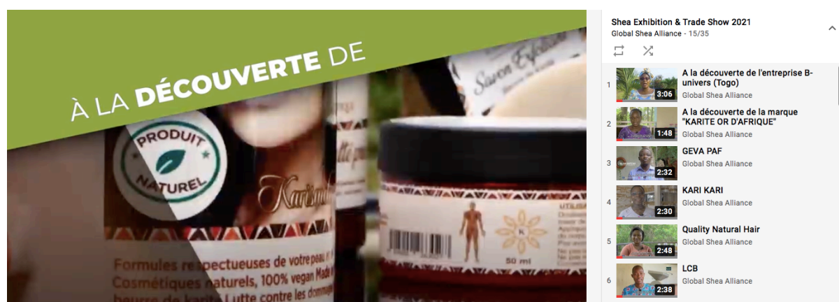
Figure 2: aperçu des entreprises de la foire virtuelle

valeur ajoutée du karité, en aidant les petites entreprises à accéder aux marchés internationaux, et en améliorant les revenus liés au commerce pour les femmes qui collectent et transforment les produits du karité. Dans cette logique, la foire virtuelle du karité apporte une nouvelle approche dans la recherche de marché en tirant profit des plateformes virtuelles compte tenu des restrictions imposées par la pandémie mondiale de la COVID-19. Sur la base d'un appel à candidature et des critères définis, les PME bénéficiaires ont été sélectionnées et accompagnées en vue de participer pleinement à ce rendez-vous d'affaires. Entre autres assistances, un atelier de renforcement de capacité sur différentes thématiques à savoir les techniques d'exposition et ventes, la négociation et la gestion commerciale, l'utilisation d'une plateforme virtuelle d'exposition, ainsi que la réalisation d'une vidéo promotionnelle mise à la disposition de chaque entreprise. “La formation m'a donné l'occasion de mieux comprendre comment tirer parti des plateformes en ligne pour promouvoir et vendre mes produits. C'est une aubaine qui s'aligne sur les attentes de mon entreprise, surtout avec la nouvelle norme qui consiste à faire tout ce que nous pouvons en ligne en raison de la COVID-19” ; souligne Falone Alognon, CEO Beauty Nap, Togo.